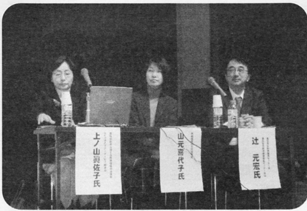
シンポジストの先生方

アルコール依存症患者では、長期にわたる栄養不良の状況でカルシウムを含む電解質バランスが異常となり、やがて精神のせん妄と全身の痙攣を起こして悲惨な結末に至ることを経験しますが、カルシウムの重要性は共感できるものと思えました。この「カルシウムパラドックス」は、カルシウム代謝の不思議を示しています。