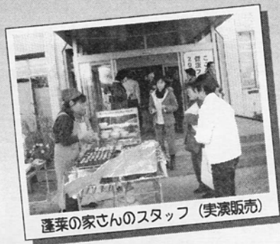
蓬菜の家さんのスタッフ (実演販売)