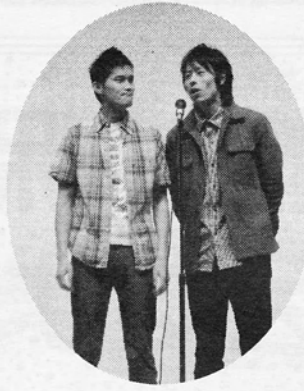
メンズサタデーズ (漫才)

はじめに、メンズサタデーズ（NPO法人サタデーピアのお笑いコンビ）による漫才が披露されて、会場は一気に和やかで暖かい雰囲気につつまれました。