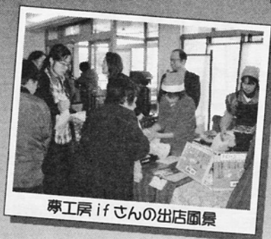
専工房 if さんの出店風景