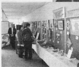
作品に見入る 来場者